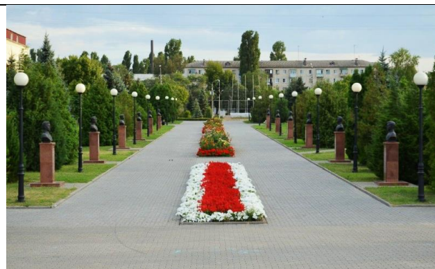
2. Аллея Героев в Парке Победы

05 мая 2010 года состоялось торжественное открытие Аллеи Героев в