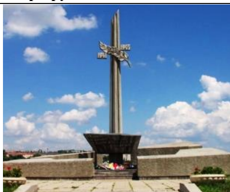
1. Памятный знак камышанам, погибшим в годы Великой Отечественной войны