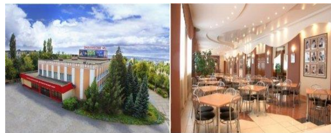
Камышинский драматический театр