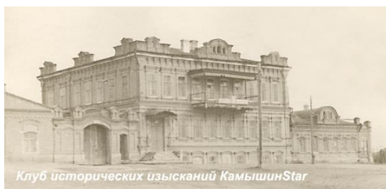
Клуб исторических изысканий КамышинStar